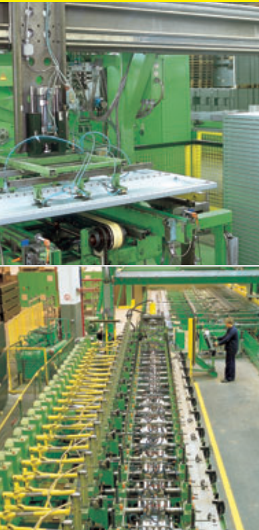
FRITZ SCHÄFER GMBH, Neunkirchen